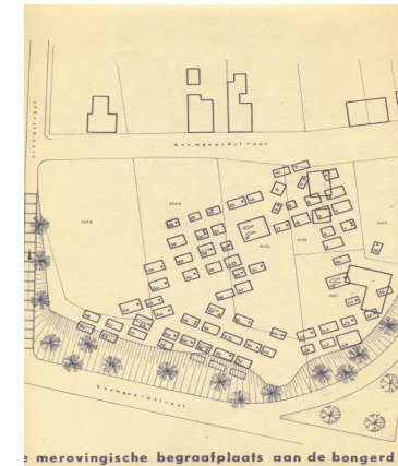
Merovingische begraafplaats aan de Bongerd te Stein

In Stein zijn geen sporen van het vroege Christendom gevonden. Wel is uit de periode van de 6 e tot de 8 e eeuw een Merovingische begraafplaats ontdekt bij de Bongerd op het Keerend in Stein. Noch in de ligging en orientatie van de graven, noch in de vondsten zijn er aanwijzingen dat het Christendom zich hier al gevestigd heeft. Ook de oude plaatsnaamgevingen in de buurt van deze begraafplaats (Hanenkraak, Zonput, Driekoulen e.d.) wijzen veeleer op heidense cultusplaatsen. Pas uit de heel sobere gegevens van het landdekenaat Susteren is te herleiden dat er in 1400 op het Keerend een kapel bestond, mogelijk gesticht door de oudste Heren van Stein die er het patronaatsrecht hadden.